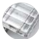
Piastra rinforzata con grigliato elettroforgiato