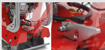
Fermo per alzare/abbassare il manubrio