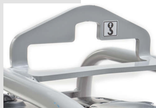
Gancio di sollevamento