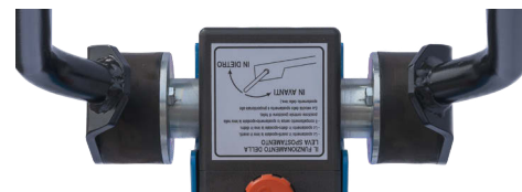
Gommini antivibratori al manubrio