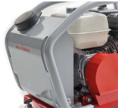
Serbatoio acqua incluso