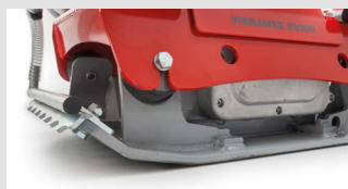
Piastra in acciaio sagomato