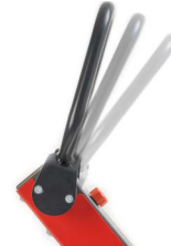
Leva spostamento avanti / indietro