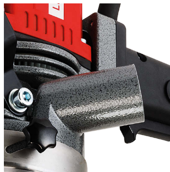
Imbocco per aspirazione Ø 36