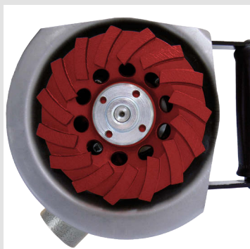
Lavorazioni negli angoli