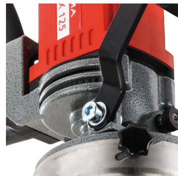
Frizione elettronica e meccanica