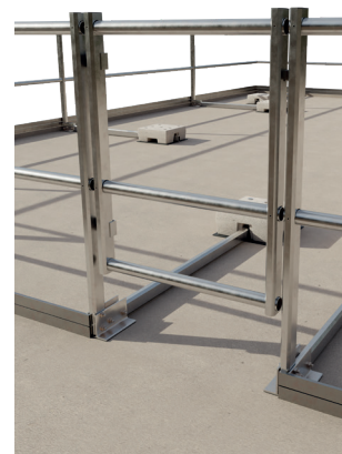
Accessorio: cancello d'accesso