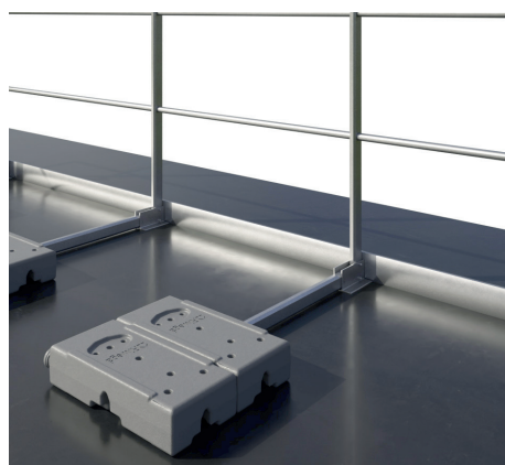
Con veletta \leq 5 cm - Rientranza min. 1 m dal bordo