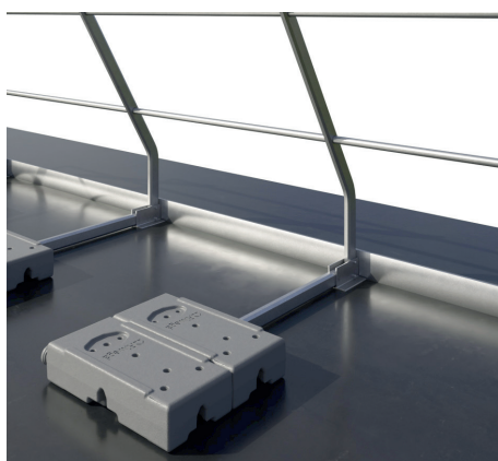
Con veletta \leq 5 cm - Rientranza min. 1 m dal bordo