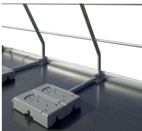
Versione 1 - con veletta da 5 cm a 10 cm