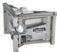
48TT - Rifinitore per angoli regolabile EasyRoll da 7,5 cm

Il rifinitore per angoli EasyRoll ha il medesimo funzionamento del tradizionale rifinitore per angoli, con il vantaggio di poter essere regolato per lasciare più o meno stucco sui lati degli angoli quando si lavora su angoli irregolari.