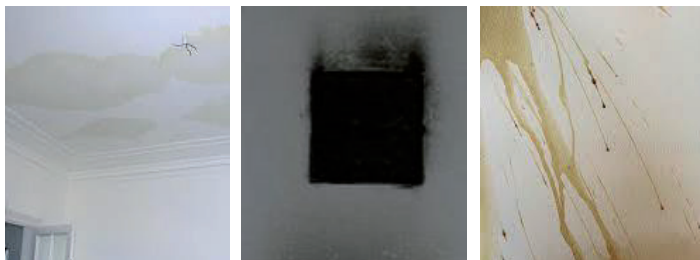
Copre macchie di infiltrazioni / nicotina / fumo / alimentari, ...

Se utilizzato su superfici porose o friabili, Primall contribuirà a stabilizzare e consolidare la superficie prevenendo l'ombreggiatura della finitura.