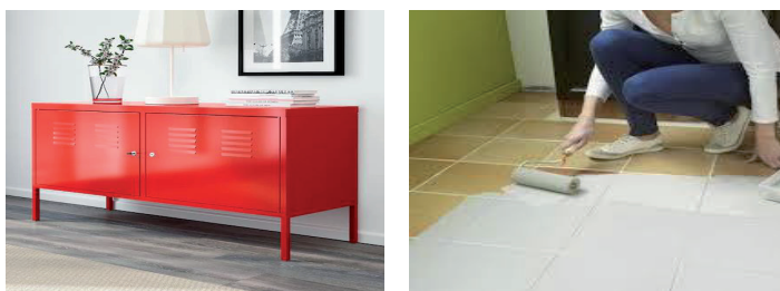
Primer diretto per superifi difficili