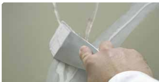
■ Fessure superiori a 2 mm. trattate con stucco elastico