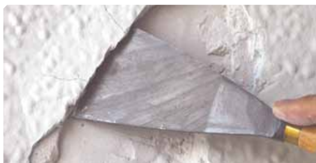
■ Fondo vecchio mal aderito