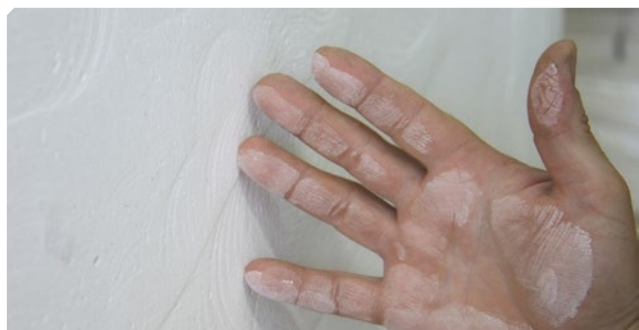
■ Supporto polveroso