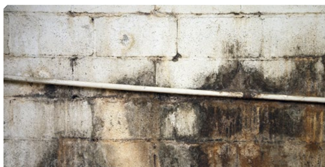
■ Umidità e microrganismi sopra il supporto