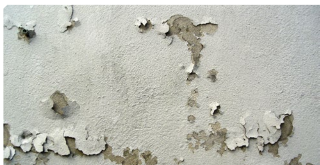
■ Fondo vecchio mal aderito