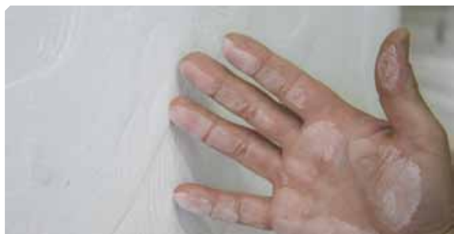
■ Supporto polveroso..