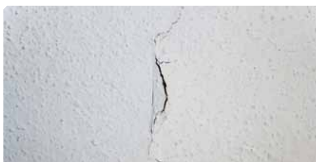
■ Crepe sopra supporto rovinato